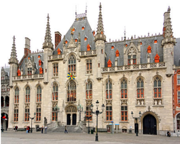
Voorgevel op de Markt van Brugge